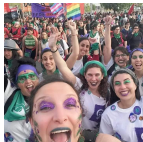
8 de marzo: Un reconocimiento a las mujeres icufistas de ayer y de hoy.