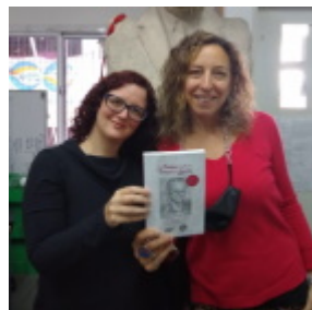
Editorial N.º 10: La Organización Femenina del ICUF (OFI), los leyen crayzn y Di idishe froi